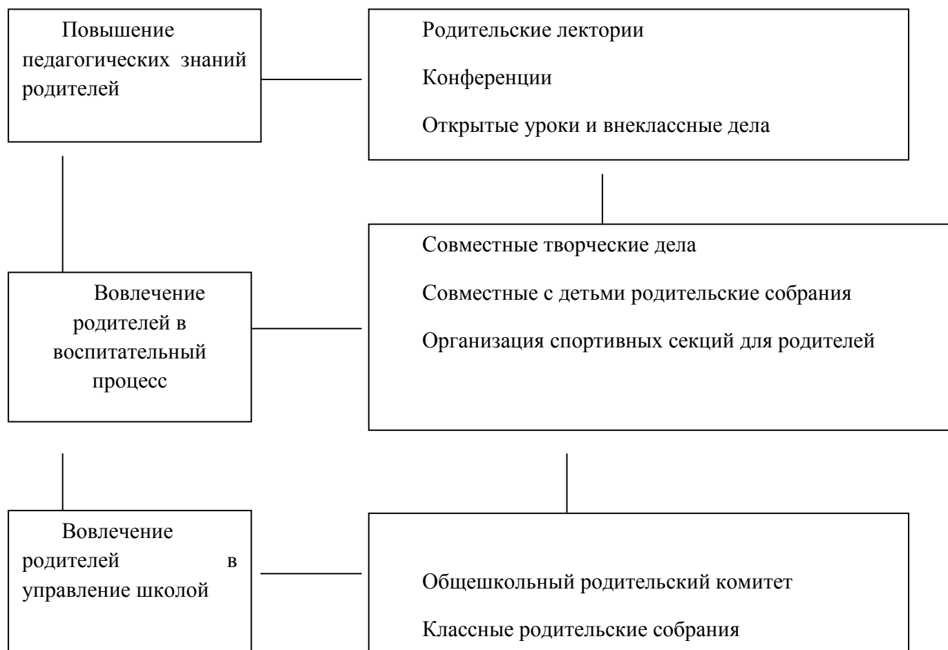
Схема взаимодействия семьи и школы